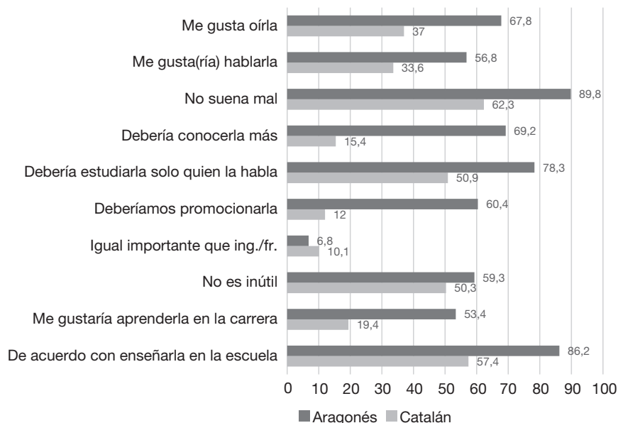
FIGURA 1 Porcentajes de respuesta favorable en los ítems relacionados con el aragonés y el catalán de Aragón

Además, destaca la diferencia actitudinal hacia las dos lenguas propias de Aragón, pues las actitudes hacia el aragonés ( \mu 6,23) se alejan significativamente de las mostradas hacia el catalán ( \mu 3,46) e incluso son más favorables que las referentes a una lengua extranjera con gran valor instrumental como es el francés ( \mu 5,74). La figura 1 ofrece los porcentajes de respuesta favorable para los ítems relacionados con el aragonés y con el catalán, ilustrando estas diferencias.